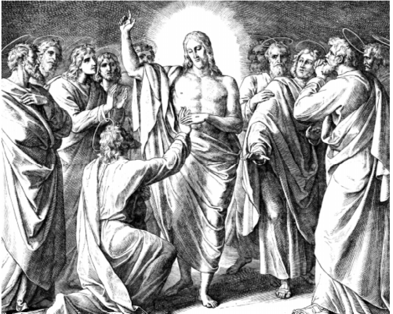
Възкръсналият Иисус Христос се явява на учениците си

гледни на съселяните си Миколенка излязъл отпред и казал само две думи - високо, радостно и тържествено: "Христос воскрес!"